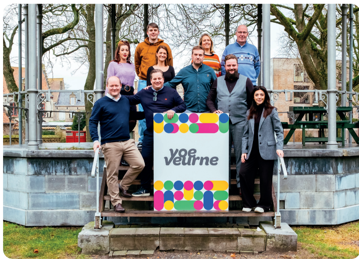
VoeVeurne: nieuwe mensen, nieuwe ideeën en nieuwe motivatie voor onze stad en haar deelgemeenten.

VoeVeurne is een onafhankelijke plaatselijke politieke partij die bewust heel veraf staat van traditionele (nationale) partijen. Vrij en vrank willen wij Veurne en haar deelgemeenten verfrissen met onze nieuwe ideeën, nieuwe aanpak, nieuwe mensen en vooral... nieuwe motivatie!